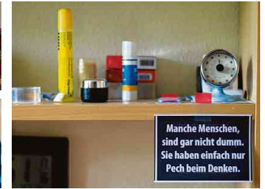
Manche Menschen, sind gar nicht dumm. Sie haben einfach nur Pech beim Denken.